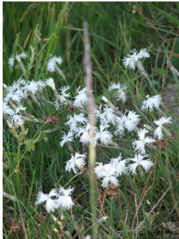
Sandnejlika vanlig i Haväng.

Den väldoftande sandnejlikan ( Dianthus arenarius ) med sitt särpräglade utseende ses i relativt stor omfattning i Haväng och framför allt på Lindgrens backar söder om Verkeån. Här kan den under försommaren breda ut sig som en vit snöliknande matta. Dess särprägel är just den aromatiska väldoft som vilken Linné beskrev redan på sin skånska resa år 1749. Strandbackarna förvandlas under sandnejlikans blomningstid till ett fullkomligt doftparadis, särskilt påtagligt när man vandrar över backarna en stilla försommarmkväll. Kronbladen är fransade med tunna smala flikar i spetsen