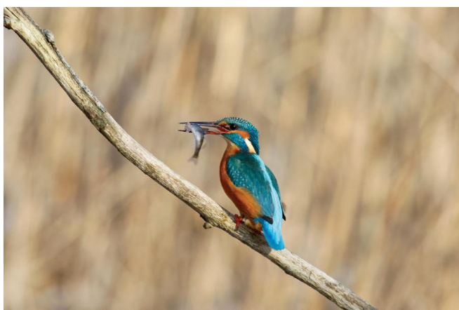
Kungsfiskaren – skygg och snabb.

Den gråsparvstora fågeln – om man bortser från den oproportionellt stora näbben – reder sitt bo i ett meterdjupt hål rakt in i en sandhaltig strandbrink. Kungsfiskaren lever av småfisk som den fångar genom en plötslig djupdykning lodrätt ner från en utsiktsgren.