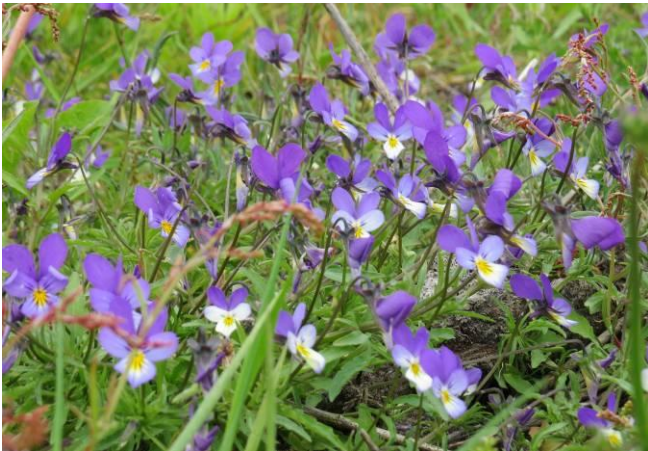
Försommar i Haväng. Styvmorsviolens firar.

Denna gång bjuder vi på ett 4-sidigt blad då vi har mycket att informera om. Dessutom har vi en specialbilaga om namnet Haväng, intressant läsning.