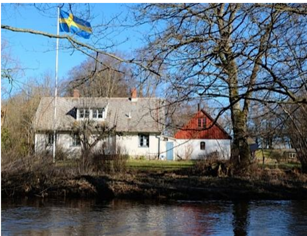
Havängsgården (Skepparp 11:5) från åsidan, före lövsprickningen.

Gården på fastigheten närmast Verkeåns mynning (Skepparp 11:5) flyttades vid skiftet från byn till dess nuvarande läge. Denna gård kallades först Gröndal. Någon gång före 1862 tycks någon av gårdens ägare (troligen C A Montan som ägde gården 1847 – 1880) ha börjat kalla gården för Haväng eller Havängen med betoning på andra stavelsen.