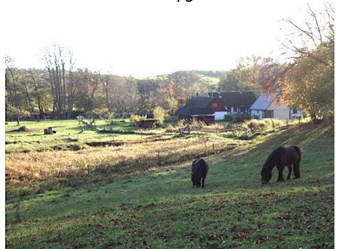
Ängen närmast havet på fastigheten Skepparp 11:5. I bakgrunden Lindgrens backar

Namnet Haväng (Hafäng) dyker upp på Generalstabskartan från 1862 och i tryck i Skånes Kalender 1878 (se sid 81 i "Skånes ortnamn" av Bertil Ejder, 1958) och sedan dess tycks namnet vara väl etablerat i bygden.