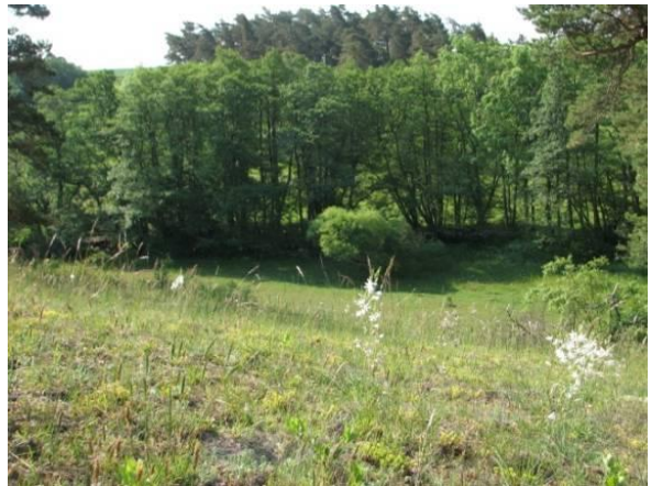
Klammersbäcks dalgång; bevara de unika kvaliteter som finns i området.