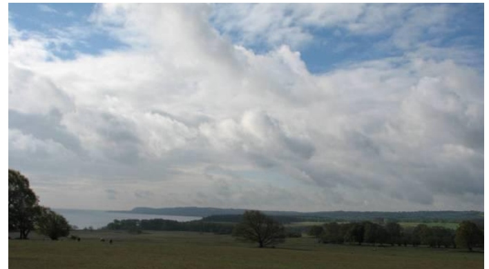
Landskapet minner om en lång period av mänsklig boning.

Havängsområdet i Ravlunda socken är väldigt rikt på fornlämningar, vilket inte minst Riksantikvarieämbetets karta visar.