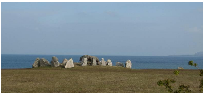
Havängsdösen kom fram ur sanden efter en storm år 1843.

Havängsdösen, Knäbäcksdösen, Verkeåns mynning med hamnanläggningen och skogen i havet. Bautastenar och jordhögar, allt bär på en historia. Många sakkunniga har varit här och gjort utforskningar. Senast utgrävningarna vid Maletofta. Stenåldern, järnåldern, bronsåldern har satt sina spår i landskapet.