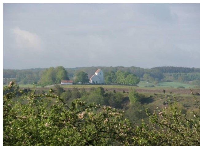
Ravlundakyrka från Linnés väg.

Havängs Museiförening Kyrkbacken 1, 277 37 Kivik Tfn 0414-74016 Bg 5932-9680