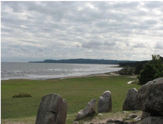
Landskapet vid Verkeåns mynning ruvar på hemligheter.