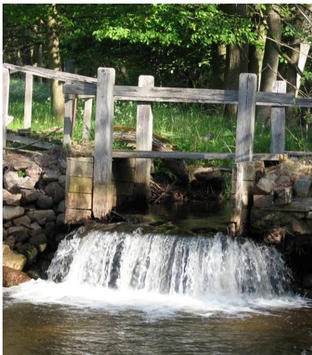
Fallkonstruktion utan fångstanordning.

Örakarsfallen som varit och är en viktig del av Haväng för boende och besökande kommer att renoveras. Projektering pågår för fullt. Skisser är framtagna, och planerna är att komma i gång i år. Förr användes fallen och fällorna för att fånga öring. Nu är de en viktig del i landskapet väl värda att bevara. Flera parter är inblandade: Christinehov/Högestad kommer att stå som huvudman, Länsstyrelsen ansvarar för att renoveringen så långt det är möjligt återskapar fallen till ursprungligt skick. Region Skåne och militären bidrar också. Statliga bidrag tillsammans med bidrag från EU står för kostnaderna. Museiföreningen har varit "pådrivare" och står för professionell sakkunskap på plats.