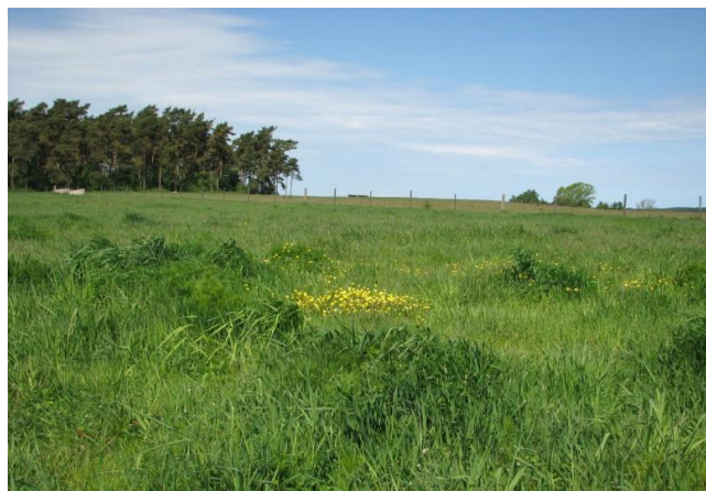
Maletoftas hemligheter döljer sig ännu under betesmarkens yta.

En spännande historia från Havängsområdet kommer fram allt tydligare.