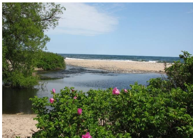
Utanför mynningen döljer sig resterna av kilometervida skogar.

"Människospår funna under havsytan" - tidningsrubrikerna var många när nya dykningar avslöjade vad som döljer sig några kilometer ut från Verkeåns mynning. Skogar och torvavlagringar, 10.000 år gamla, och väl bevarade i Hanöbukts lagom salta vatten. Avsikten med dykningar i maj var att få ytterligare en bild av skogarna och hitta spår efter mänsklig verksamhet. Hisnande historiska perspektiv sätter fart på fantasin. Planer finns på att visa fyndigheterna och berätta historien kring dessa i en utställning i Simrishamn.