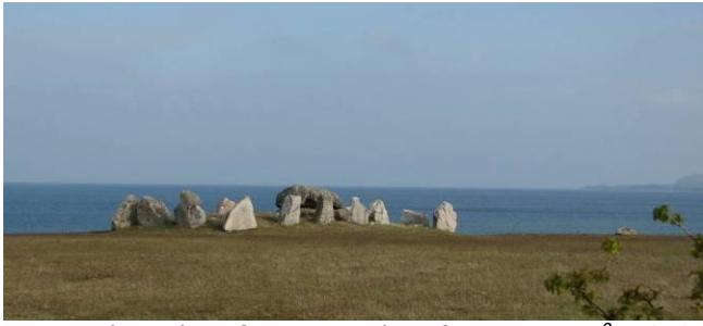
Havängsdösen kom fram ur sanden efter en storm år 1843.

H avängsdösen, Knäbäcksdösen, Verkeåns mynning med hamnanläggningen och skogen i havet. Bautastenar och jordhögar, allt bär på en historia. Många sakkunniga har varit här och gjort utforskningar. Senast utgrävningarna vid Maletofta. Stenåldern, järnåldern, bronsåldern har satt sina spår i landskapet.