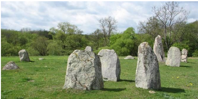
Bautastenarna söder om Örakersgården.

H avängsdösen, Knäbäcksdösen, Verkeåns mynning med hamnanläggningen och skogen i havet. Bautastenar och jordhögar, allt bär på en historia. Många sakkunniga har varit här och gjort utforskningar. Senast utgrävningarna vid Maletofta. Stenåldern, järnåldern, bronsåldern har satt sina spår i landskapet.