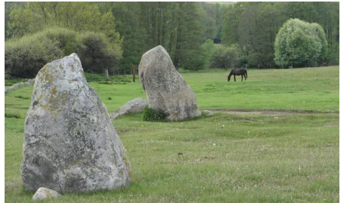
Resta stenar väster om Örakersgården.

http://www.fmis.raa.se/cocoon/fornsok/search.html;jsessionid=A3EB688E2EC3C73A6733C8632E94496C?objektid=10110500400001&tab=3