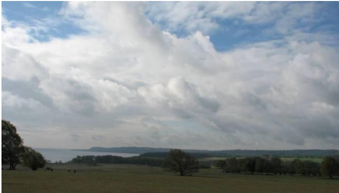
Landskapet minner om en lång period av mänsklig boning.

Vi startar ett nytt tema i vårt Medlemsblad maj 2011 med en presentation av några av de fornlämningar som finns i Havängsområdet. Havängsdösen tillhör ett av landets mera kända och mest besökta, men det finns mer. I detta medlemsblad presenterar vi en förteckning och i senare nummer fördjupar vi oss i vissa.